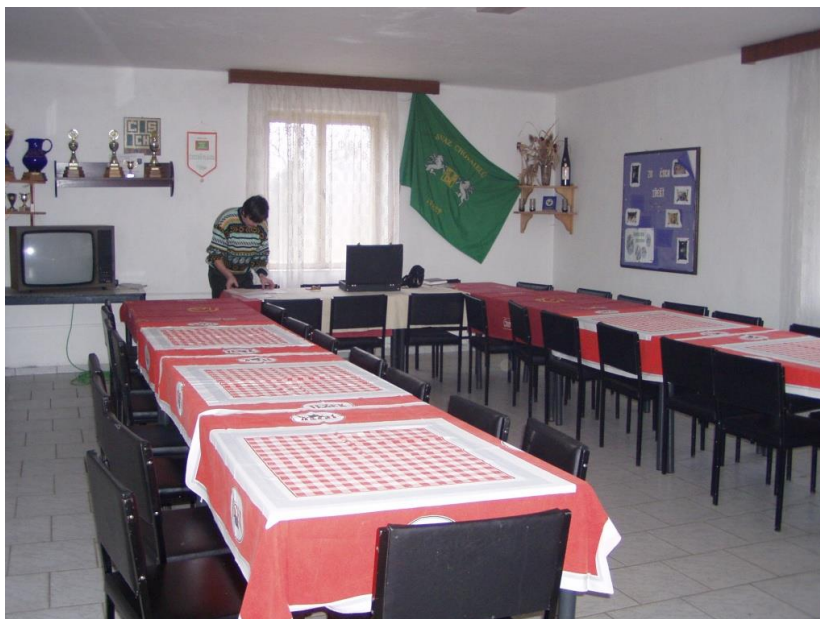
Klubovna připravena na VČS