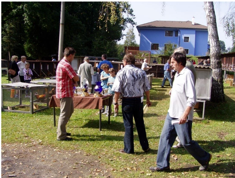
Před vyhlášením výsledků výstavy