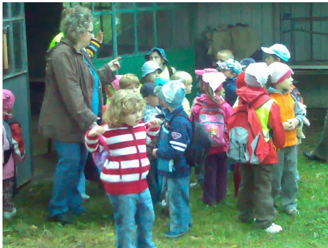
Děti MŠ na návštěvě výstavy