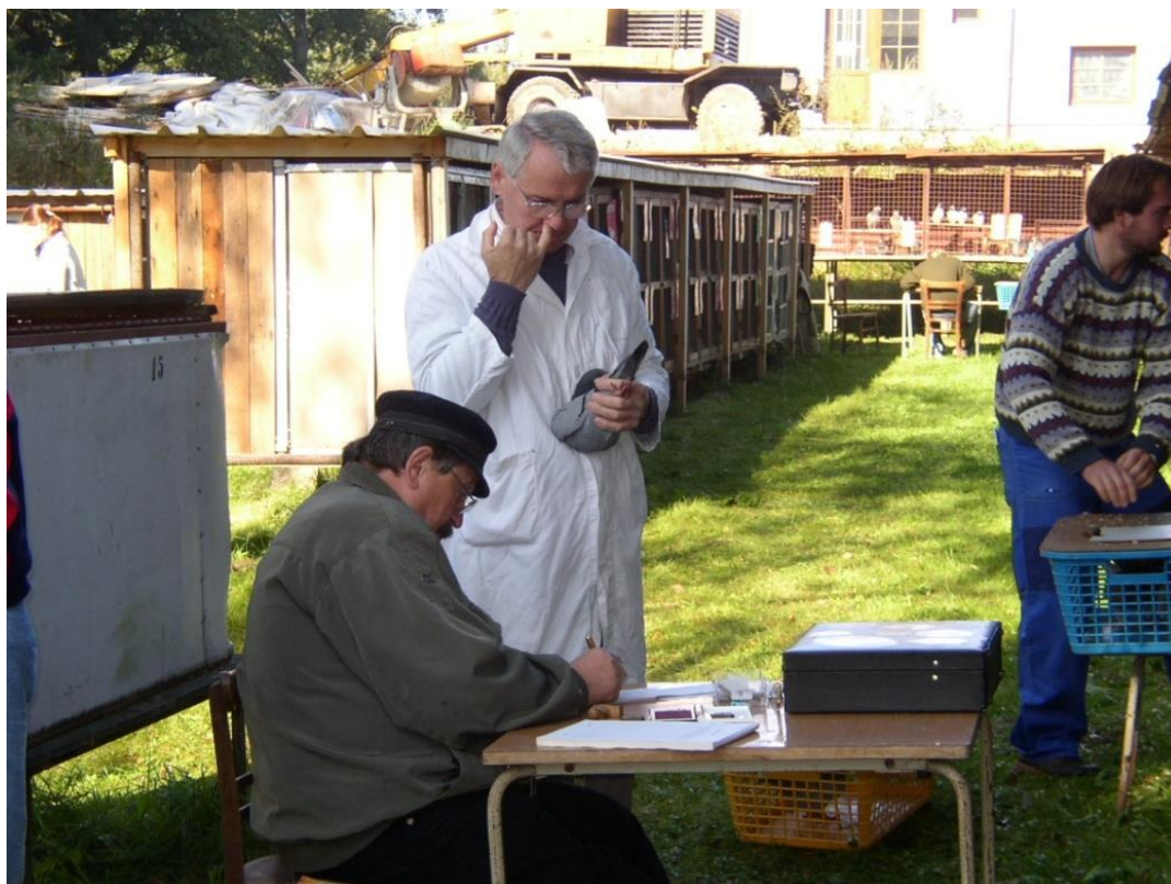
Foto z výstavy Třešťský jednorožec v září 2005