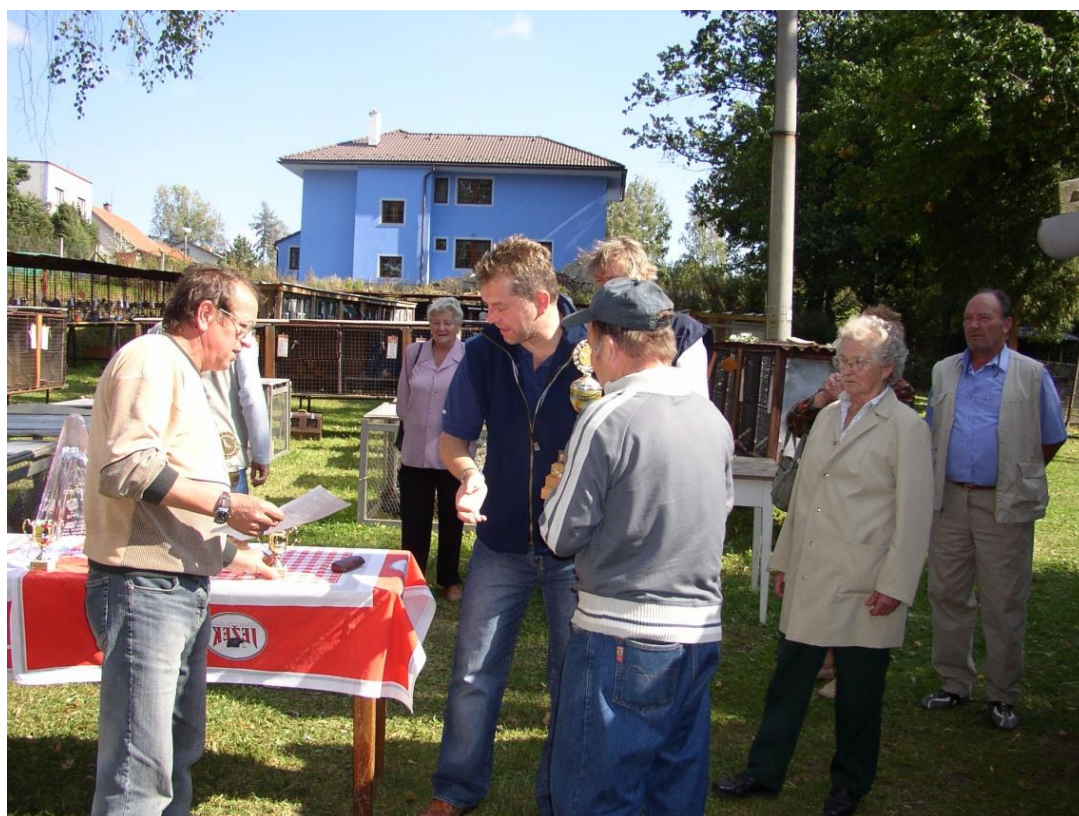
Předávání čestných cen a vítězných pohárů