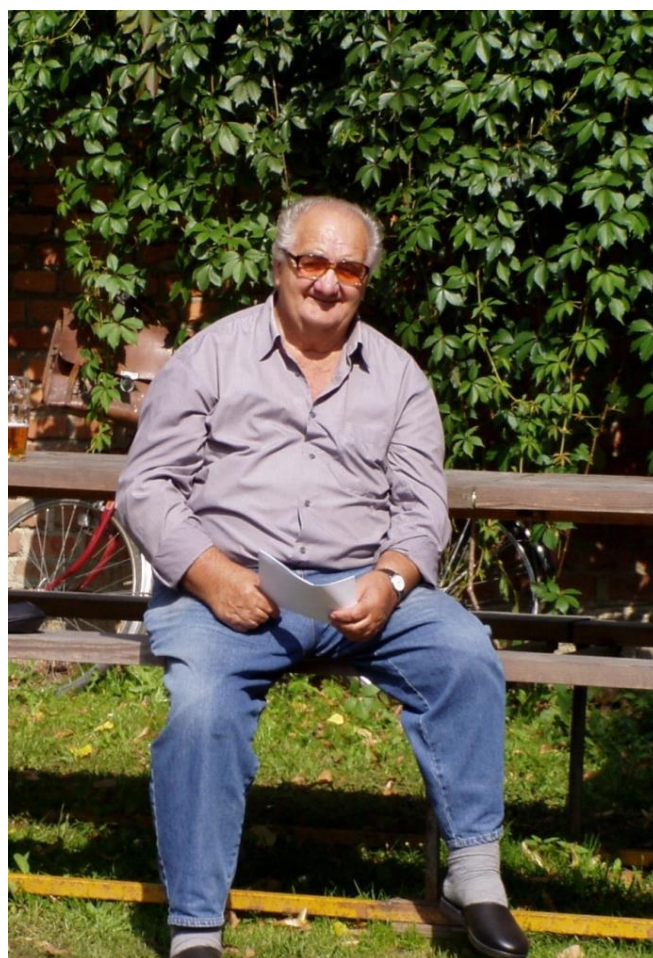
Př. Svoboda ZO Jihlava