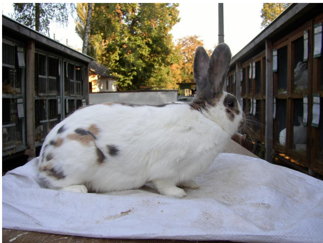
Tříbarevný strakáč modrozlutý vyšlechtěný př. Fr. Vítů