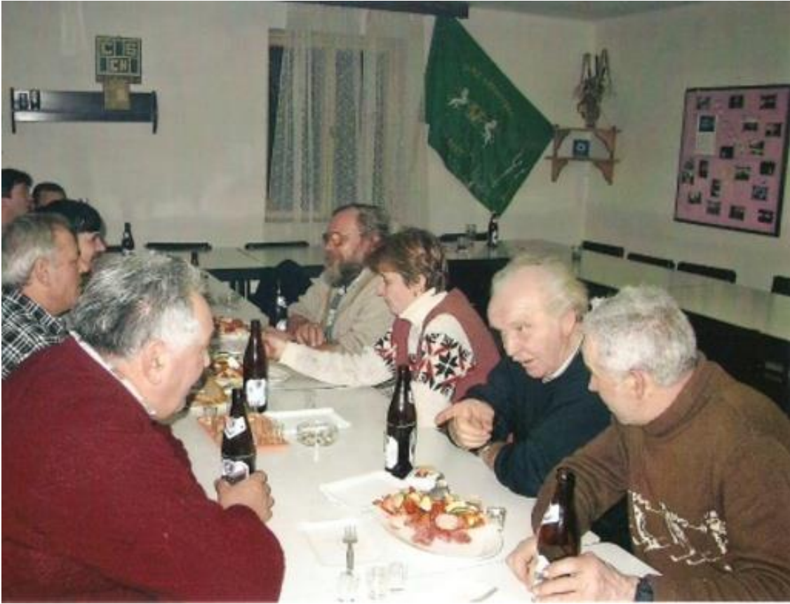
Foto z výstavy Třeštský jednorozec září 2004