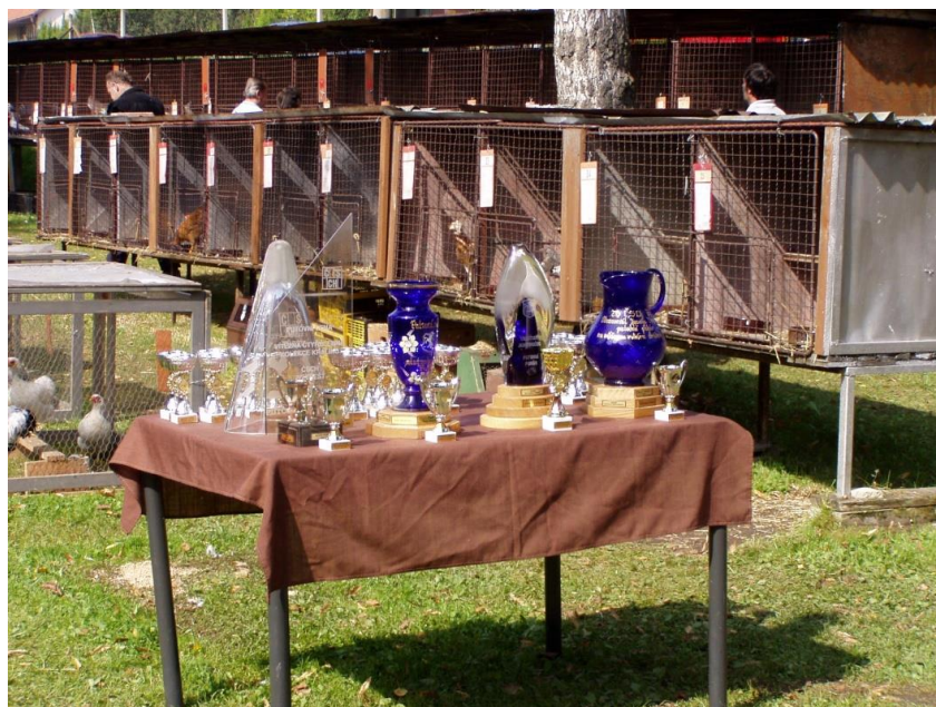
Foto z výstavy Třešťský jednorozec září 2009