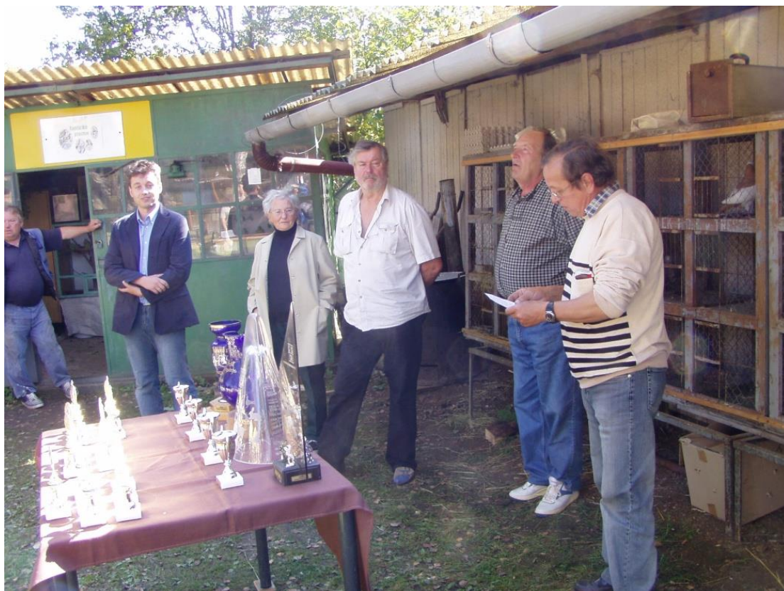
Vyhlášení výsledků výstavy