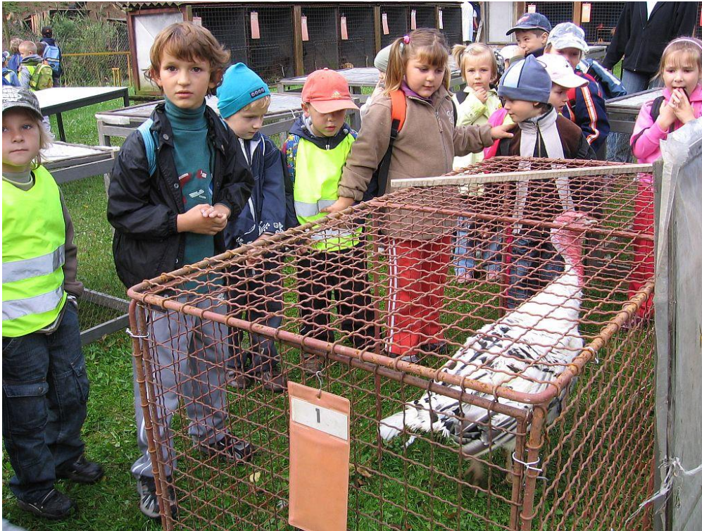
Návštěva dětí MŠ