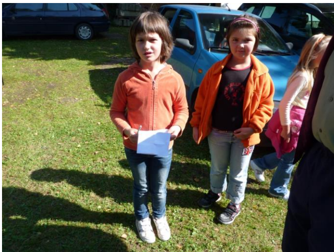
Děti mateřské školy