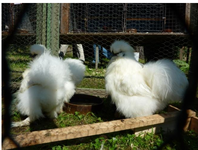
Hedvábníčky bílé, vítěz memoriálu J. Drasticha