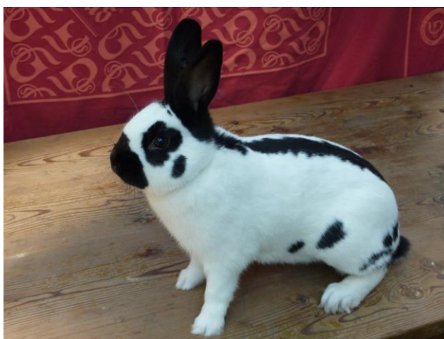
Český strakáč černý