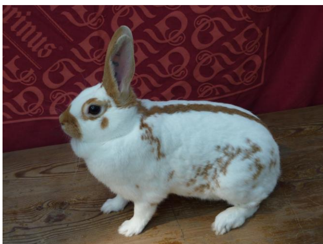
Anglický strakáč žlutý