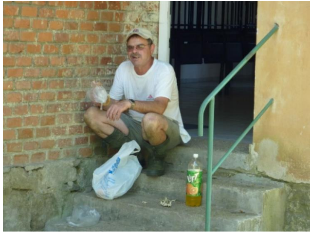
Foto z výroční členské schůze 2010