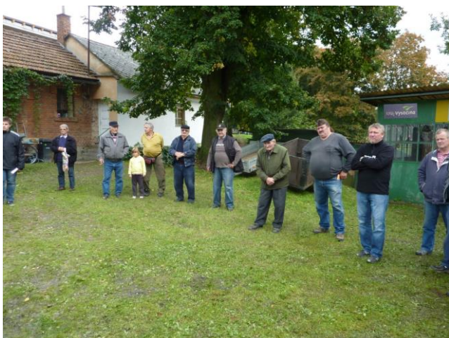
Vyhlášení výsledků výstavy