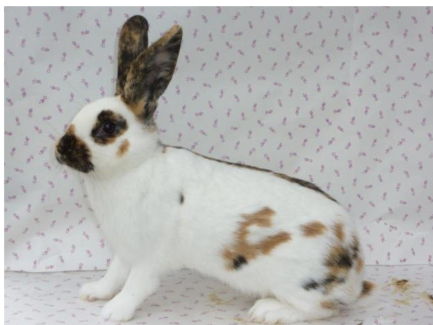
ký strakáč černožlutý