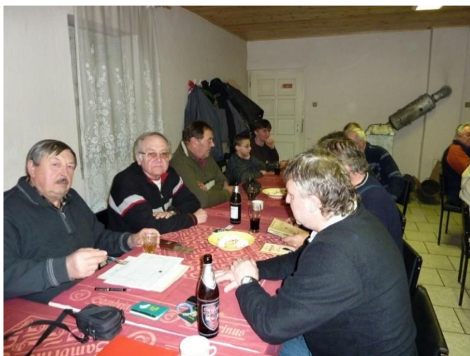
Foto výroční členská schůze 2012