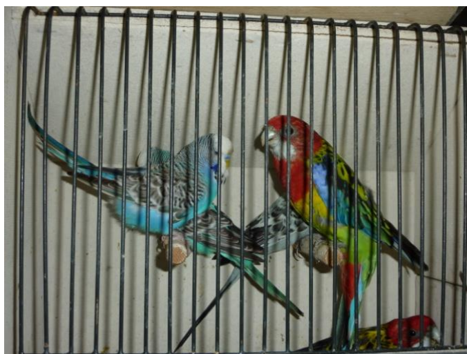
Expozice okrasného ptactva