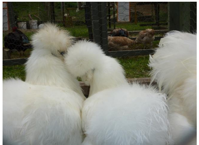
Zdrobnělá hedvábnička bílá