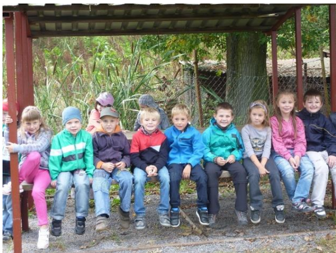
Děti MŠ Třešť