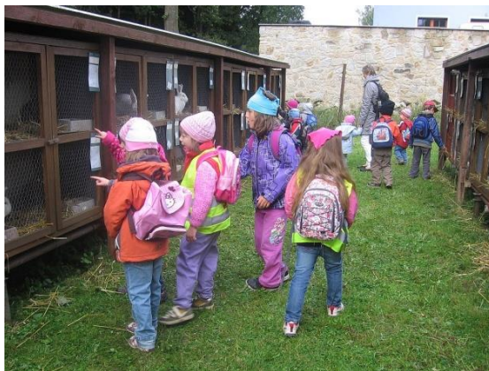
Výstavu navštívíi děti mateřské školy.