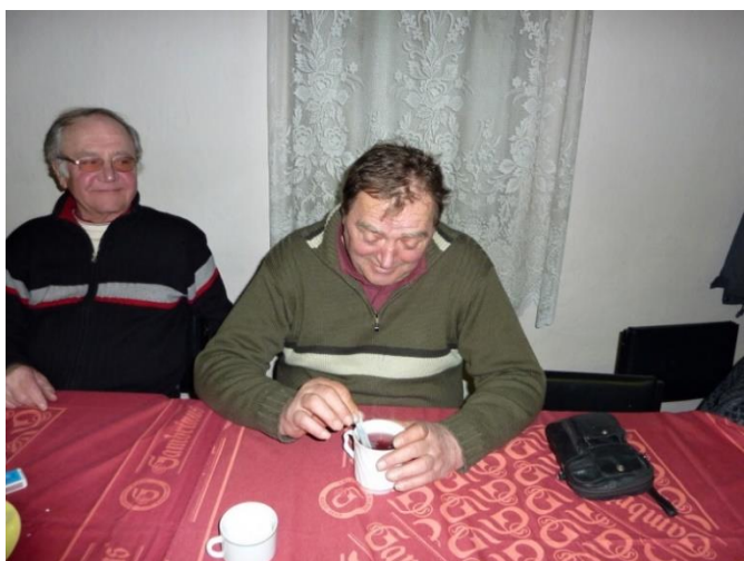
Hink Mil. Burda