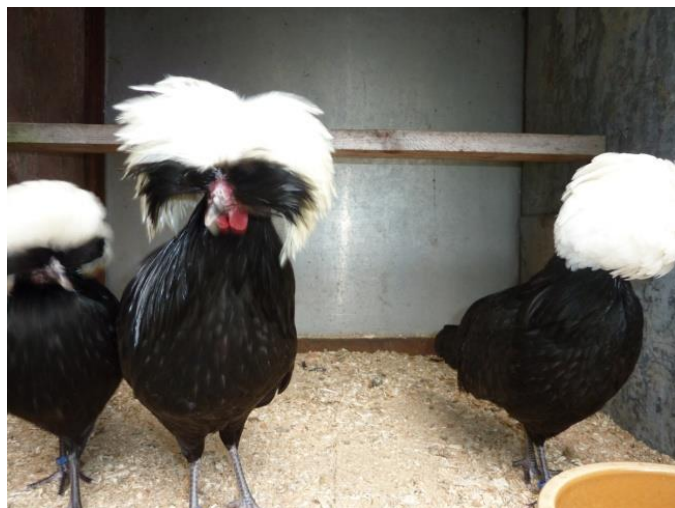
Zdrobnělá holanďanka černá