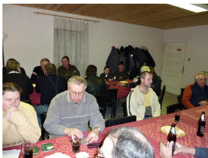
Foto z výstavy Třešský jednorožec 2012