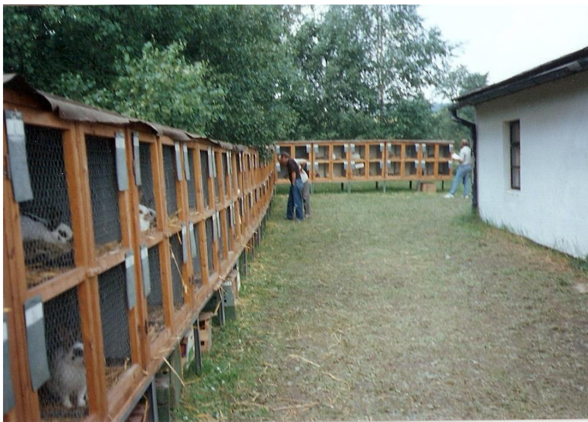
Foto z letní výstavy 1996