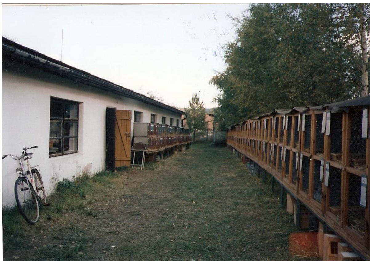
Foto z okresní výstavy říjen 1995