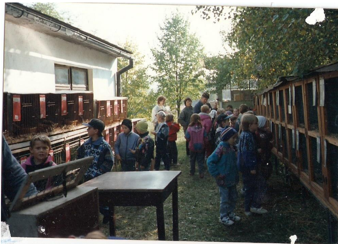
Výstavu navštívily děti MŠ