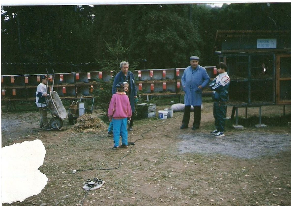
Úklid po výstavě