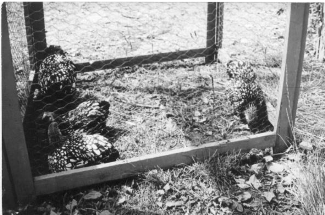
Foto z letní výstavy konané na zahradě restaurace Společenský dům

Z výstavy ve Společenském domu v Třešti 1981