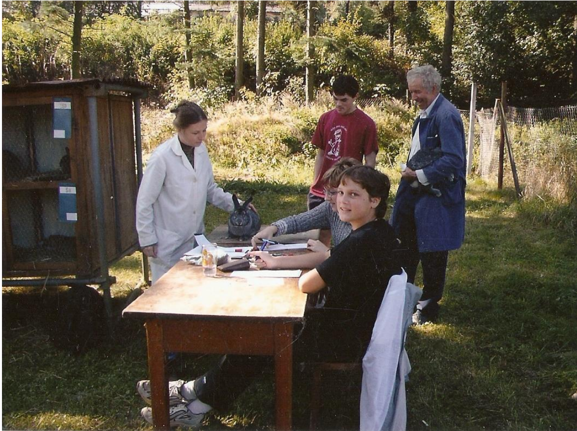
Foto z letní výstavy červenec 2003