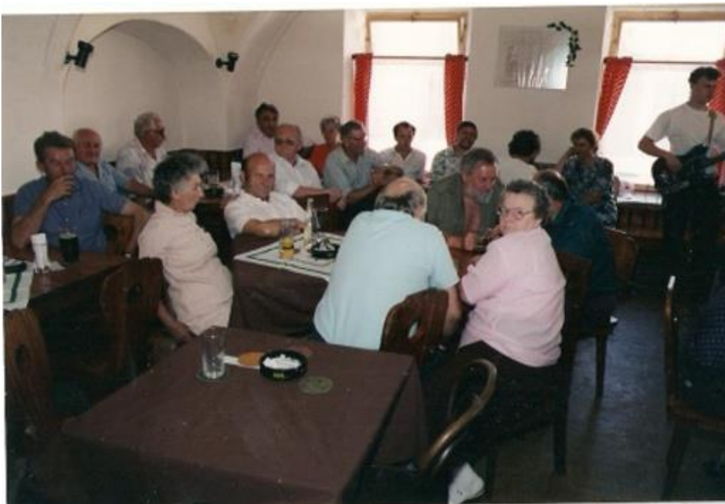
V restauraci U Rumcajse