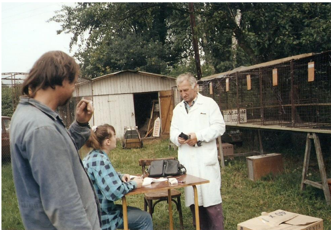
Foto z letní místní výstav 1997